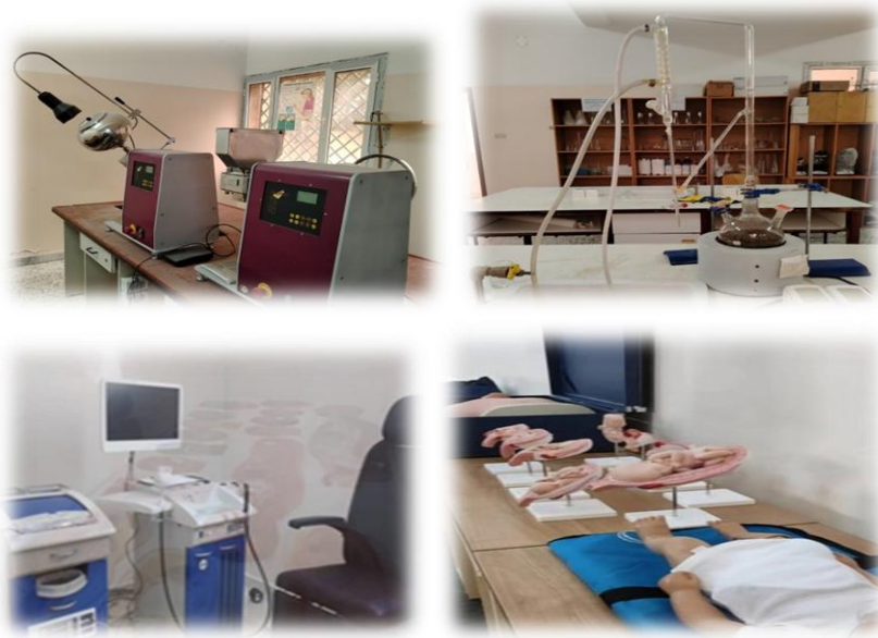
الشكل 3-3: معامل كلية التقنية الطبية

كما تم تزويد كلية التقنية الطبية بعدد من الاجهزة المعملية وذلك لتقديم تعليم طبي متميز وإعداد كوادر طبية مؤهلة قادرة على تقديم الخدمات والرعاية الصحية من أجل تزويد طلاب الجامعة بالمعرفة الطبية الأساسية، وتنمية مهاراتهم من خلال هذه الأجهزة.